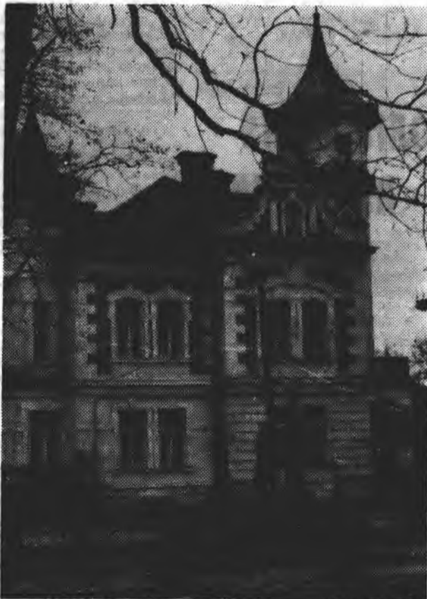
НА ФОТОКОНКУРС «РП»

— Ну, тоді зайду зранку, — попрощався габровець.